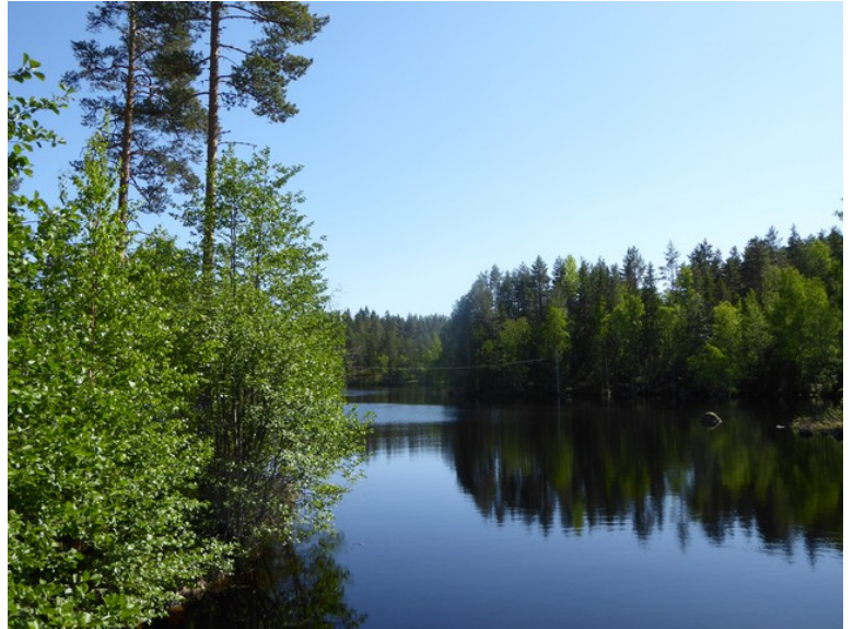
Dette er Varaldsjøen.