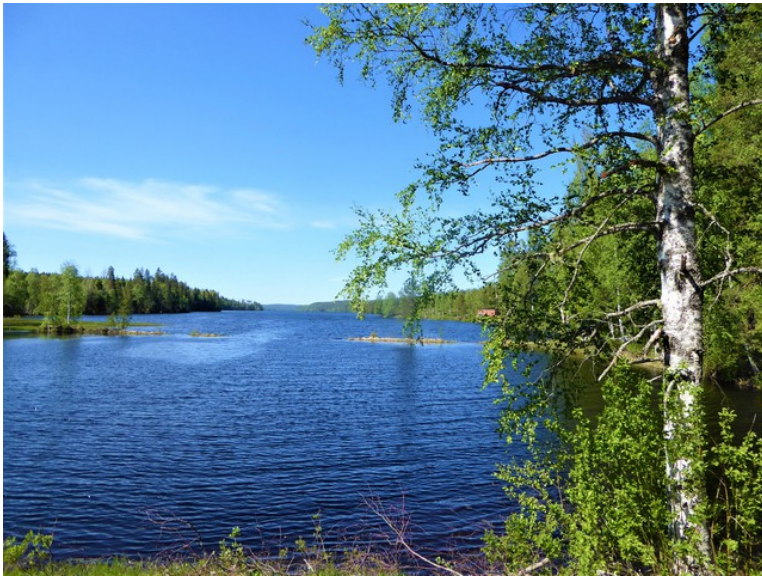
Dette er sydenden av Varaldsjøen.