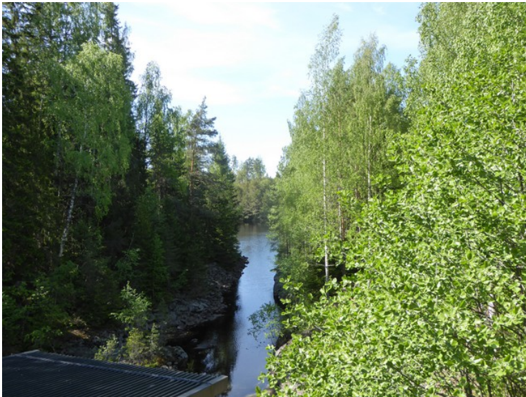
Utsikt nedover Sikåa.