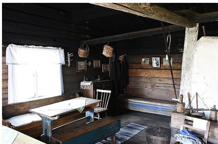
Interiør fra røykstuen.