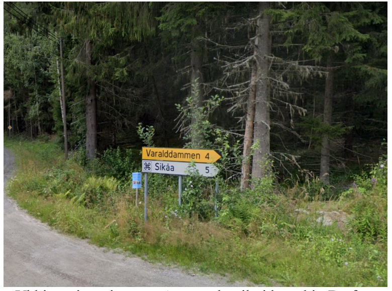
Vi kjørte i retning mot Austmarka til vi kom hit. Da fant jeg ut at jeg ville se restene etter spikerverket ved Sikåa.