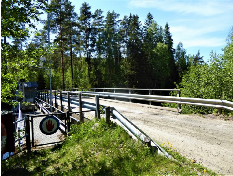
Her er vi kommet til Varalddammen.